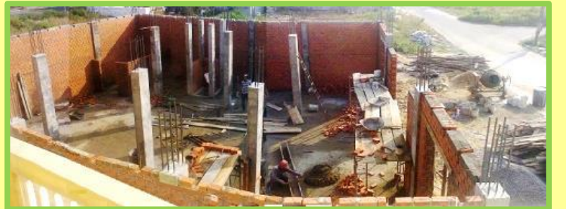
Những cột trụ được và cả những bức tường bên ngoài được xây dựng.