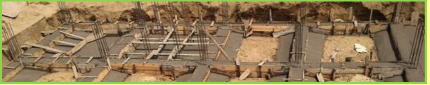
Sau một tuần nền móng đã hoàn tất.

Không lâu sau khi nền móng được xây dựng. Những bức tường xung quanh nền móng cũng được xây lên. Nhiều du khách và các hàng xóm tỏ ra quan tâm. Tất cả chúng tôi rất hài lòng về những người thợ xây dựng. Họ mong muốn xây dựng nhiều tầng hơn, nhưng chúng tôi chỉ có thể xây nên một. Sự quyết tâm của người dân Việt Nam luôn là một ví dụ cho nhiều người ngoại quốc và tất cả các nước láng giềng. Đây là phần còn lại của bức ảnh: