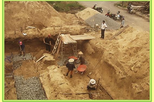
Các công nhân đang tạo những khung gỗ và lấp đầy chúng bằng sỏi và xi măng.