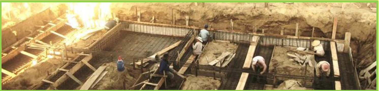
Làm việc rất cực nhọc nhưng hiệu quả rất cao. Để có thể làm cho nền móng phẳng sàng để đổ bê tông.