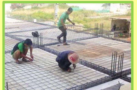
Hàng khối tấn sắt đã được sử dụng cho trần nhà. Phải mất một thời gian trước khi nó sẵn sàng để được lấp đầy bằng bê tông.