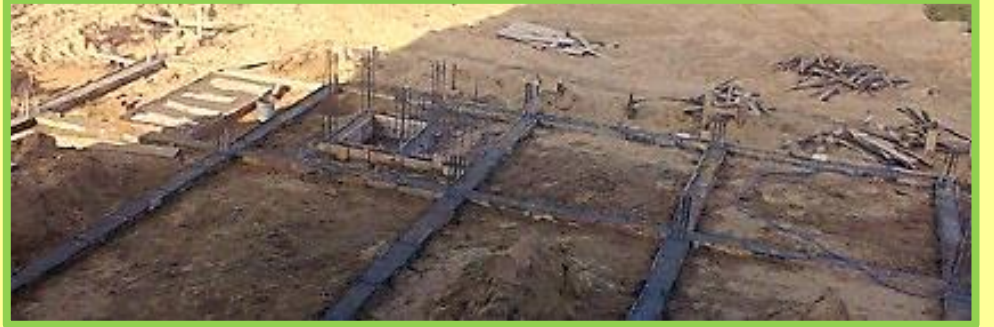
Nền móng đã được lấp đầy cát, để sẵn sàng cho việc xây lên 24 cột trụ