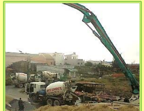
Chín xe trộn bê tông để có thể lấp đầy nền móng cùng với một máy bơm hiện đại.