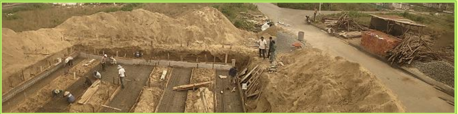
Bước tiếp theo là làm đầy khuôn với sắt thép.