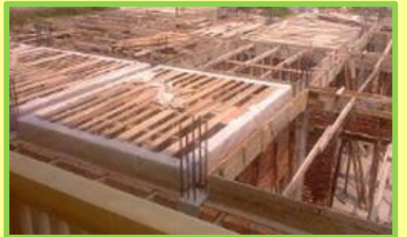
Sau một tháng các khung trần bằng gỗ được chế tạo